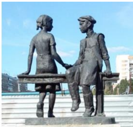
Памятник "Несовершеннолетним труженикам тыла 1941—1945 годов благодарная Самара"

9 Мая - самый дорогой праздник. Все меньше остается тех, кто ковал Победу на фронте и в тылу. Помнить о фронтовиках - долг живущих на земле, но нельзя забывать и тех, кто на алтарь Победы положил свое детство, здоровье, а иногда и жизнь, кто затем восстанавливал с вернувшимися фронтовиками страну из руин, поднимал разрушенное хозяйство. Война слишком рано ворвалась в детскую душу, проглотила наше детство и пропахала глубокую борозду через судьбу каждого подростка. Когда началась война, мне исполнилось 14 лет. Я окончила 6-й класс на «отлично». Впереди было счастливое веселое лето 1941 года.